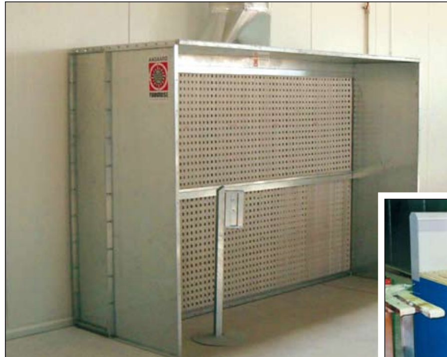
Шлифовальный стол с автономной вытяжкой и двумя фильтрами внутри стола.

Фирма Aagaard предлагает в своей программе также сухие стенки для покраски с фильтром Andre.